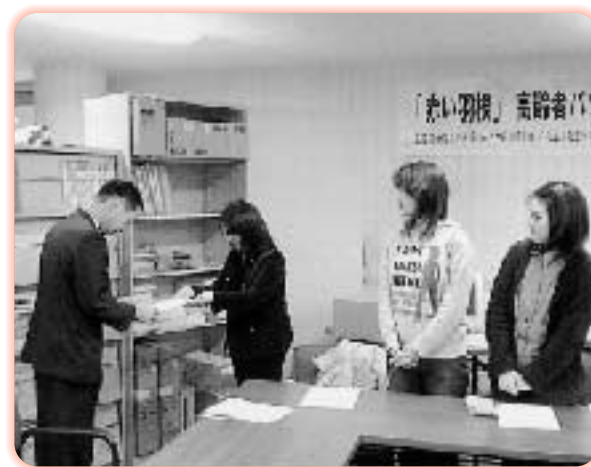
③乳幼児医療費無料の要望 3月18日、御津町と灘崎町の合併前に、就学前まで乳幼児医療費の無料化を求めて市に要望。若いお母さん達と！