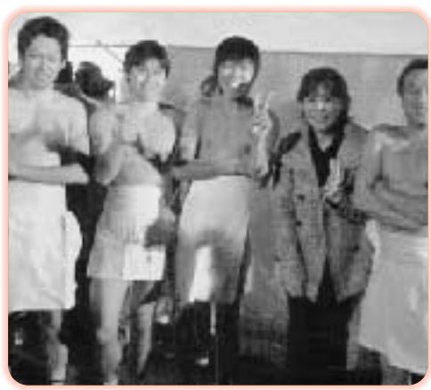
⑤西大寺支部「エイステイバル」開催 2月7日、西大寺郷土芸能フェスティバルがありました！毎年楽しみにおにぎり劇団の劇、今年は観音院の鐘にまつわるお話、住職役の方とバチリ！