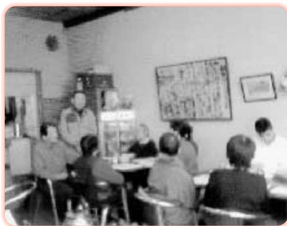
②憲法を読む会 憲法を読む会、憲法9条改悪阻止西大寺共同セミナー立ち上げ総会が三月五日に開催されました！ギター演奏をバックに憲法をじっくり読みました