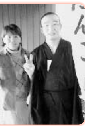
⑧介護保険のはなし 3月6日11日、岡山医療生活健康祭りにて介護保険制度の改悪の中止について講演しました。改悪されるとして入居の妨げ、改悪されるとして負担が増えます。また家事援助がヘルパー制度から外れるなど問題だらけです！ぜひ改悪阻止のため勉強しましょう！講師に呼んでください