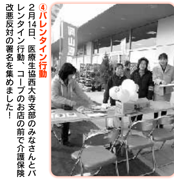
④パレンティン行動 2月14日、医療生活西大寺支部のみなさんとパレンティン行動。コープのお店の前で介護保険改悪反対の署名を集めました！